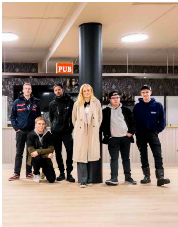
Några av de aktiva i årets förening Lappfjärd UF.

SÖU fungerar som stöd, rådgivare och intressebevakare. Genom utbildning, handledning och strategiskt arbete ser vi till att medlemsföreningarna har kraft och struktur att utvecklas. Vi arbetar för att föreningarna ska stå stadigt organisatoriskt och ekonomiskt, och samtidigt våga tänka nytt.