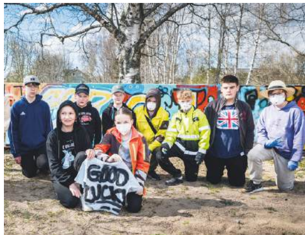
Graffiti lockade fram kreativiteten bland ungdomarna.

Arbetet med att introducera pidro till barn och ungdomar har visat sig mer utmanande än väntat. Den nuvarande turneringsformen förutsätter att spelare binder upp sig till regelbundna spelkvällar i ungdomslokalerna, något som inte alltid passar ungas mer flexibla fritid i dag. Samtidigt finns positiva initiativ. Flera föreningar ordnar informella spelkvällar vid sidan av turneringen, vilket fungerar som en lågtröskelväg för nya spelare att bekanta sig med spelet.