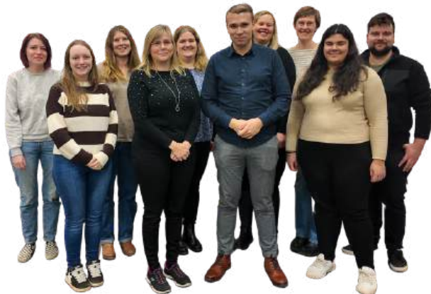
Ung kraft i rörelse. Här har styrelsemedlemmar från Österbottens alla hörn samlats till höstens strategimöte.

Arbetet för ökad jämlikhet och hållbarhet har tagit viktiga steg under året. Finlands Svenska Ungdomsförbund har inlett arbetet med en förbundsövergripande handlingsplan mot kränkningar, trakasserier och sexuella övergrepp, där SÖU deltar aktivt.