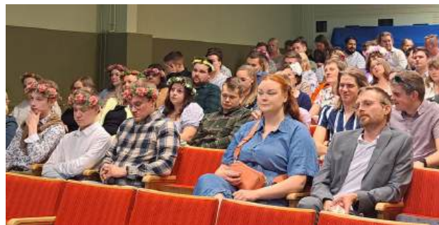
Johannesgalan hade temat "Messomasdröömin", något som också märktes i höstmötesdelegaternas klädsel. Höstmötet hålls traditionellt i samband med galan.

SÖU ordnar kurser och nätverksträffar enligt föreningsfältets behov. Under 2025 var intresset för ordningsvaktskurserna särskilt stort. Grundkursen samlade 40 deltagare och repetitionskursen ytterligare 20 deltagare.