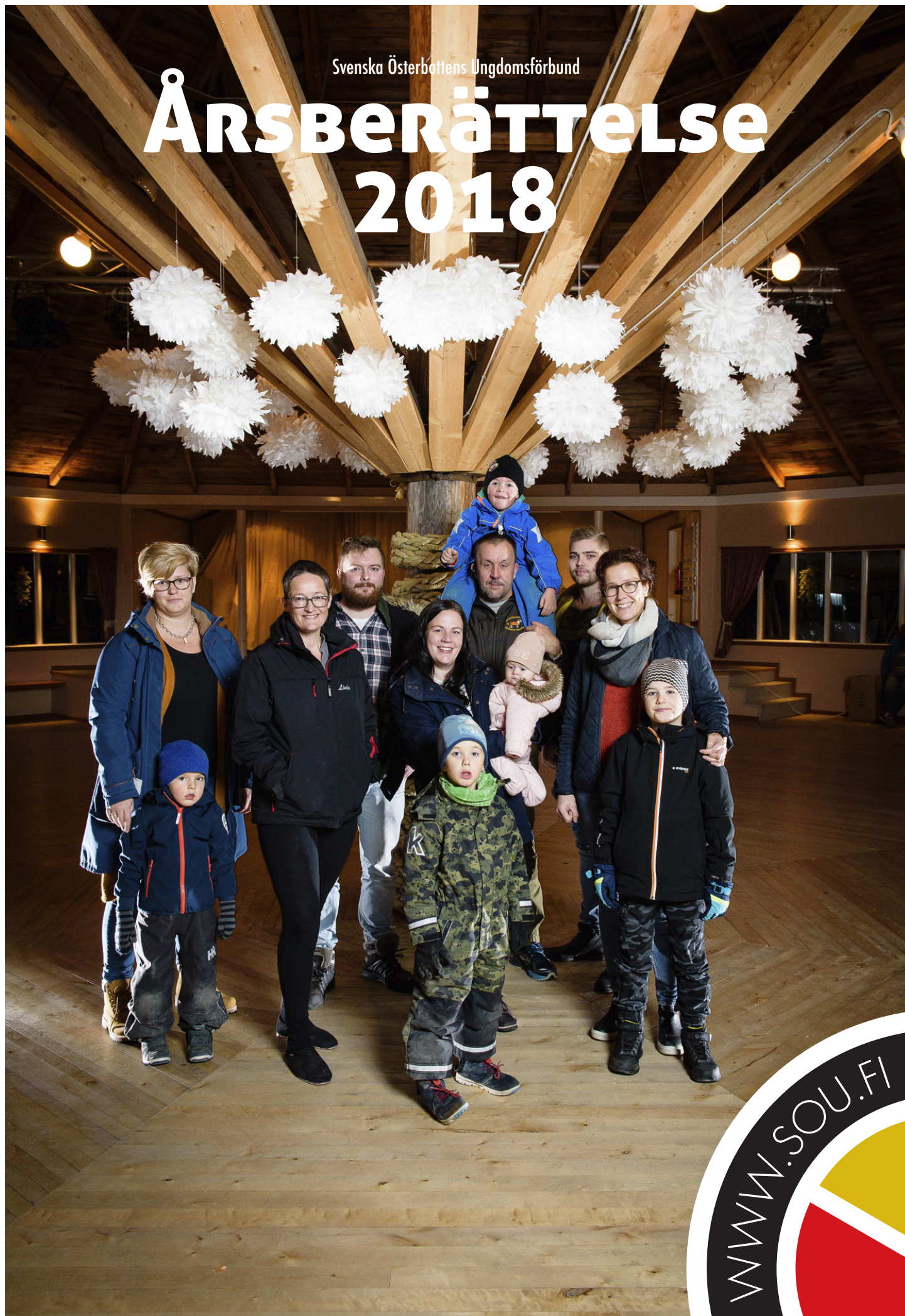
På bilden: Molpe UF blev årets förening inom SÖU i samband med Johannesgalan 2018.