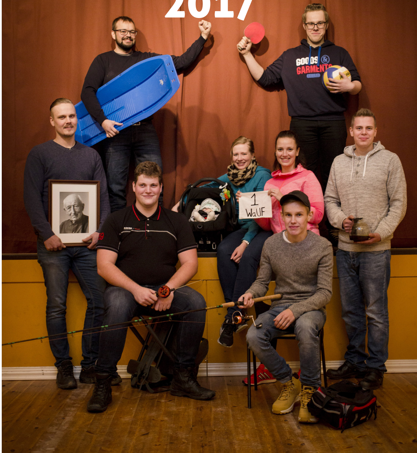
På bilden: Wassor UF som blev årets förening inom SÖU i samband med Johannesgalan 2017.