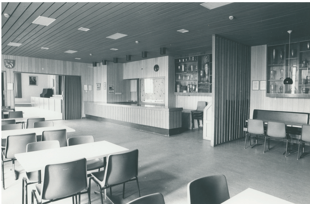
De flesta föreningar har en egen fastighet, dessa kräver kontinuerligt resurser.

Föreningshusen är navet i byn. Husen är den naturliga samlingsplatsen och skapar ramarna för vilka verksamhetsformer som kan bedrivas. Att fastigheterna är funktionella och i gott skick samt att driftskostnaderna hålls på en rimlig nivå är centralt för föreningarna. SÖU bidrar med kunskap och strävar efter att bidra till upprätthållandet av fastigheterna genom olika åtgärder, främst lobbyverksamhet och myndighetskontakter. Förbundet fungerar även som utlåtandeorgan för sökta statliga renoveringsbidrag för den egna medlemskåren. Under 2017 bör inledande av en långsiktig plan uppgöras gällande hur fastigheterna bevaras och förvaltas de kommande 10, 50 och 100 åren. Genomsnittsåldern på föreningshusen är hög och i vissa fall kan en maximal livslängd börja närma sig.