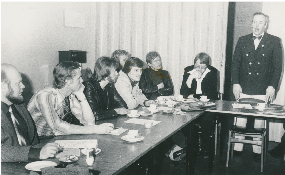
En viktig del av förbundets verksamhet är en aktiv och engagerad styrelse.