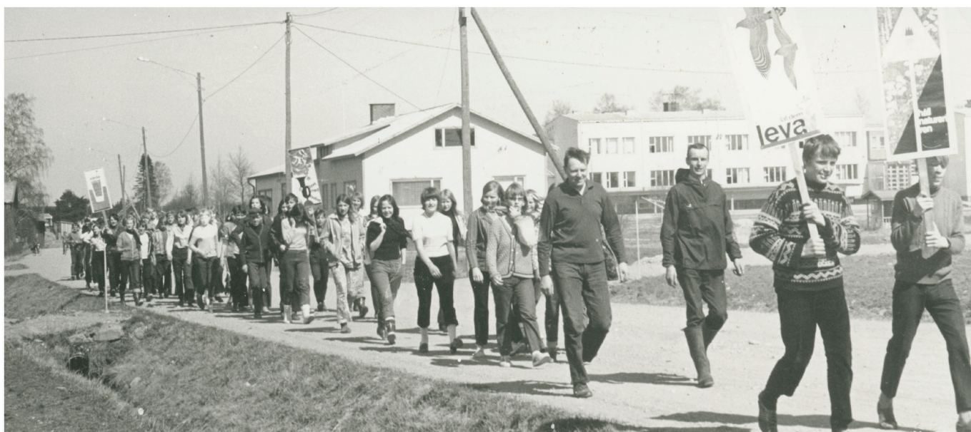
SÖU har kontinuerligt projektverksamhet som brukar engagera medlemskåren.

Som en del av Finland 100 jubileumsåret, arrangerar FSU musikprojektet UNG MUSIK för ungdomar. Projektet ger oetablerade orkestrar och artister en möjlighet att uppträda, samt att få feedback av etablerade yrkesutövare i branschen. Inom ramen för projektet erbjuder vi en möjlighet för artisterna och orkestrarna att delta i två olika veckoslutskurser inom musik. Vi strävar vidare till att samla in information om aktiva finlandssvenska artister eller orkestrar, till en databank på internet. Projektet arrangeras i samarbete med SÖU, NSU, ÅUF, ÅLUF, DUNK och YLE.