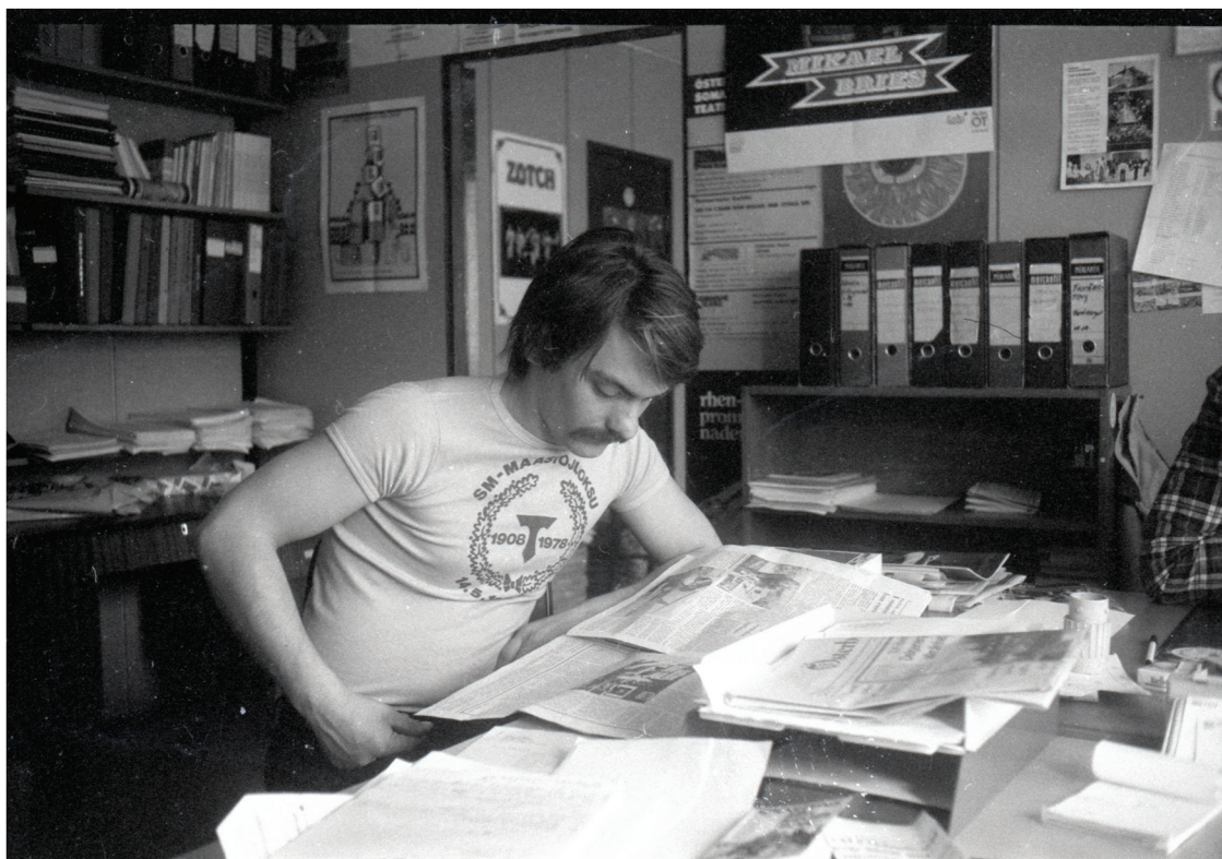
Centralkansliet är organisationens nav.

SÖU är medlem i FSU, Finlands Svenska Ungdomsförbund, och deltar gärna i samarbete och utbyte mellan takorganisationen och övriga ungdomsförbund samt andra förbund, föreningar och organisationer med liknande ambitioner.